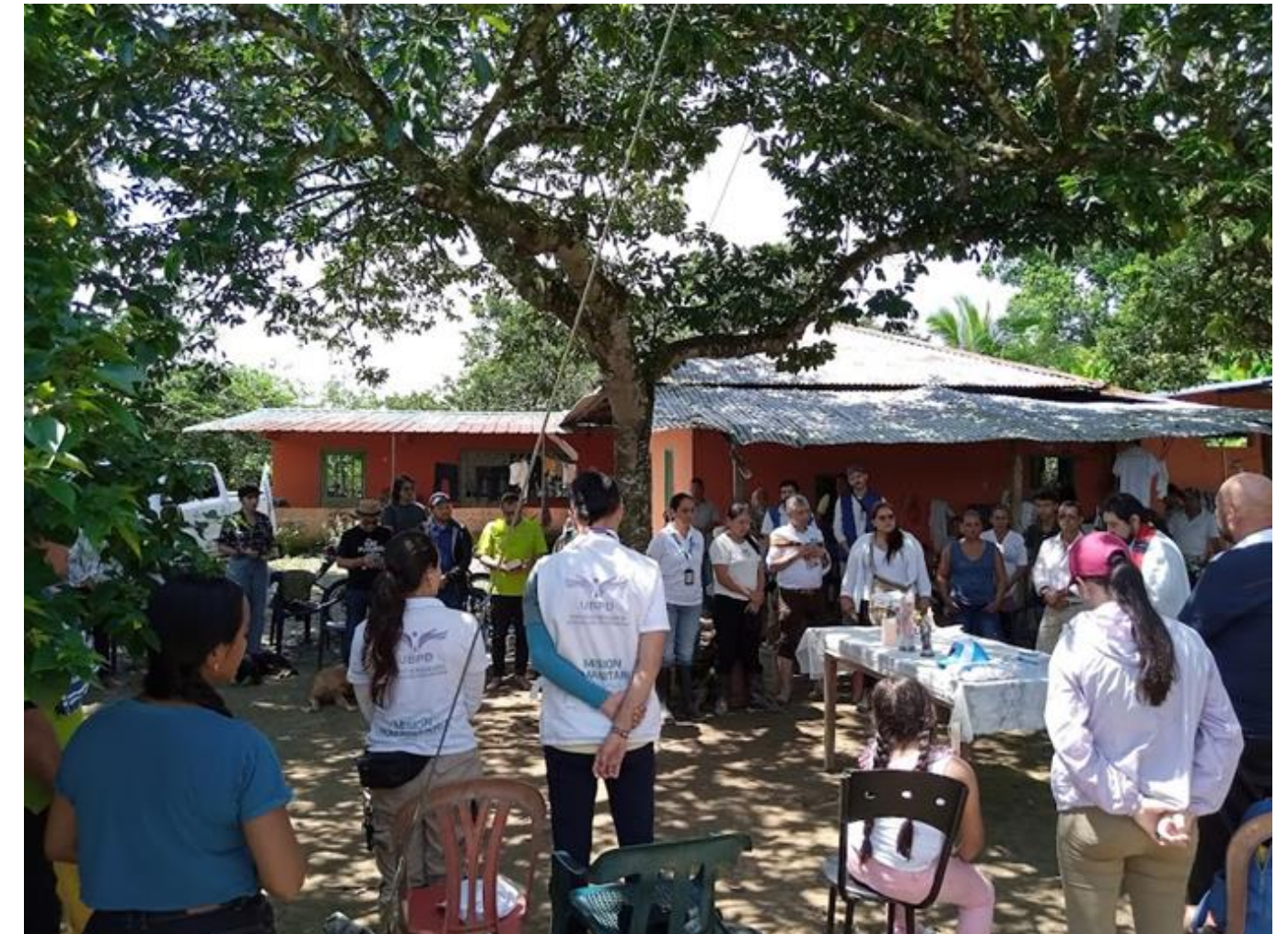
Peregrinación de la memoria de los mártires campesinos del Alto Ariari