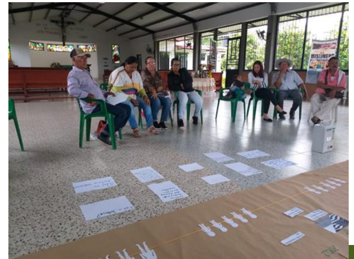
Recolección, organización de datos, análisis de información