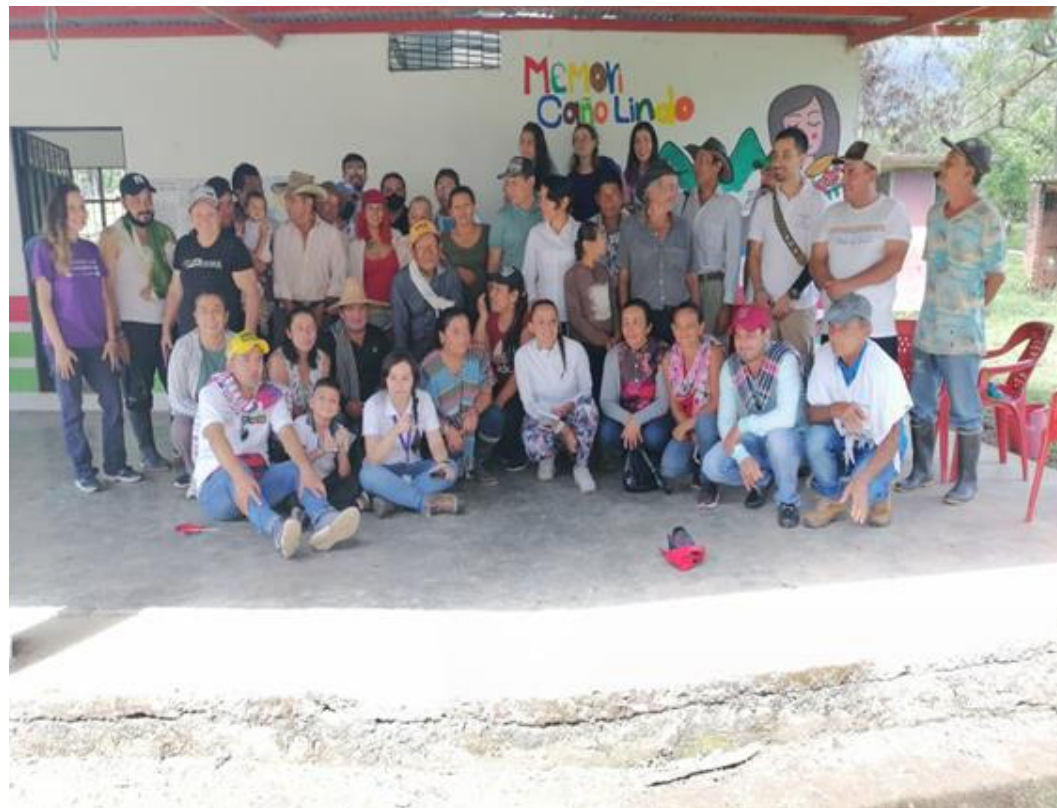
Acompañamiento a familiares de personas desaparecidas

Esta búsqueda se realiza junto con la Unidad de Búsqueda de Personas Dadas por desaparecidos, quien se encarga de la búsqueda con el acompañamiento de los misioneros claretianos.