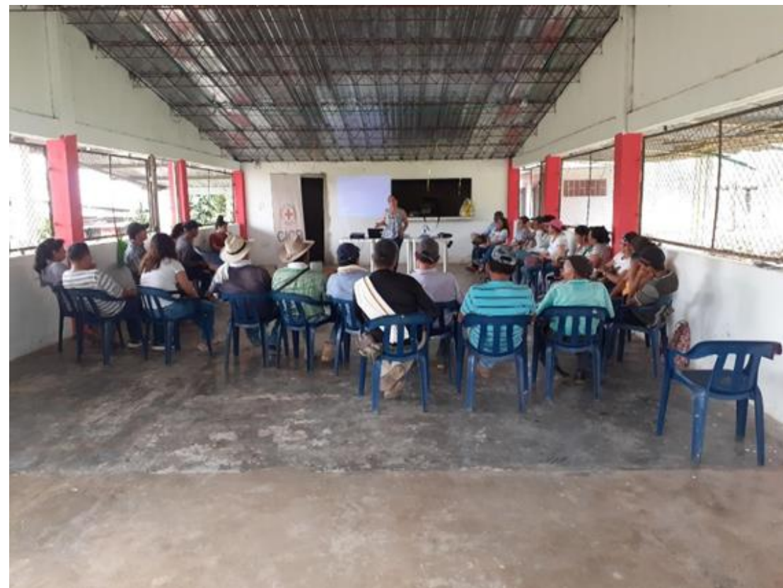
Formación a los familiares