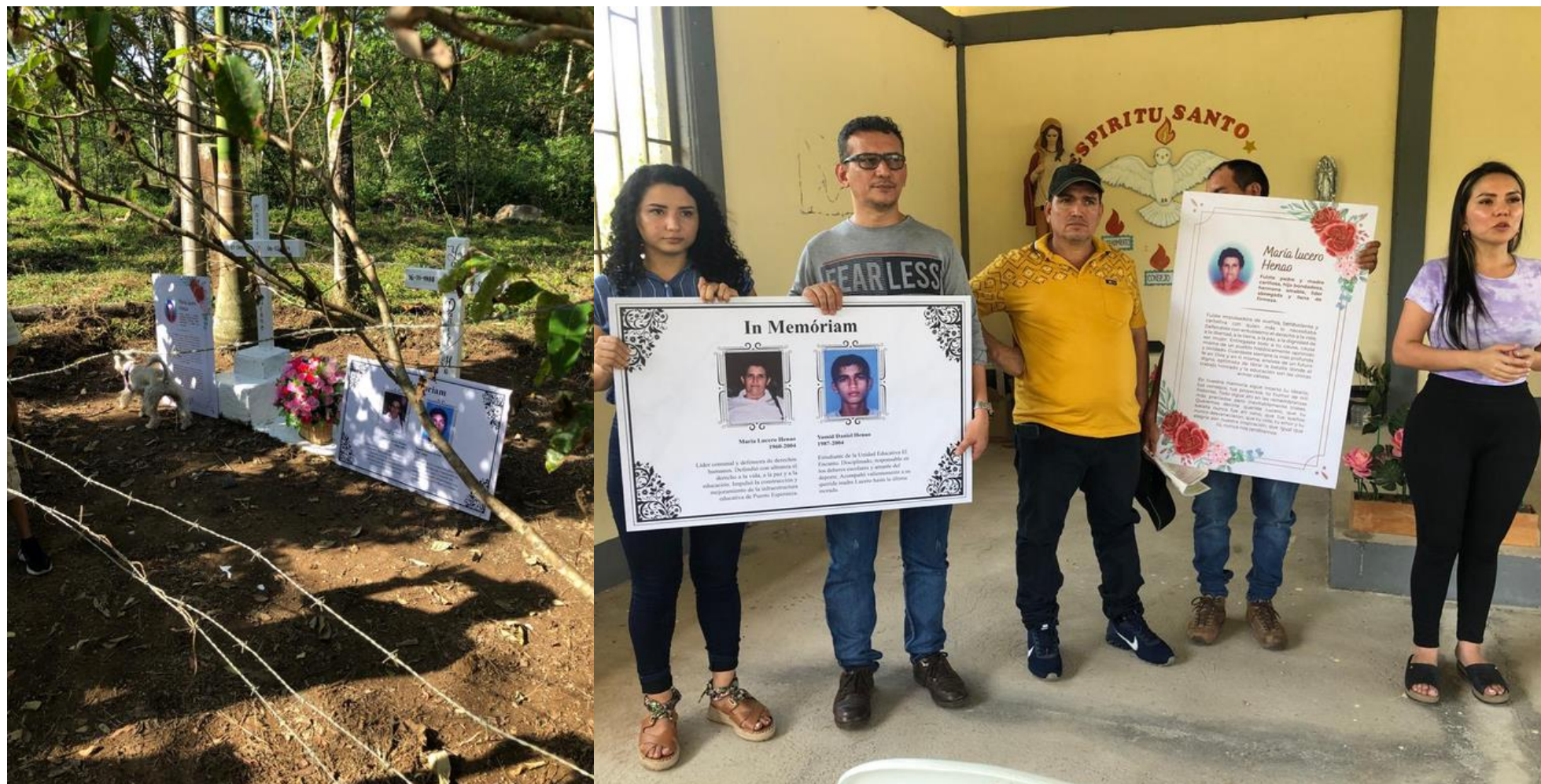
Denuncias a través de comunicados públicos con otras organizaciones sociales, análisis de la realidad de los derechos humanos.