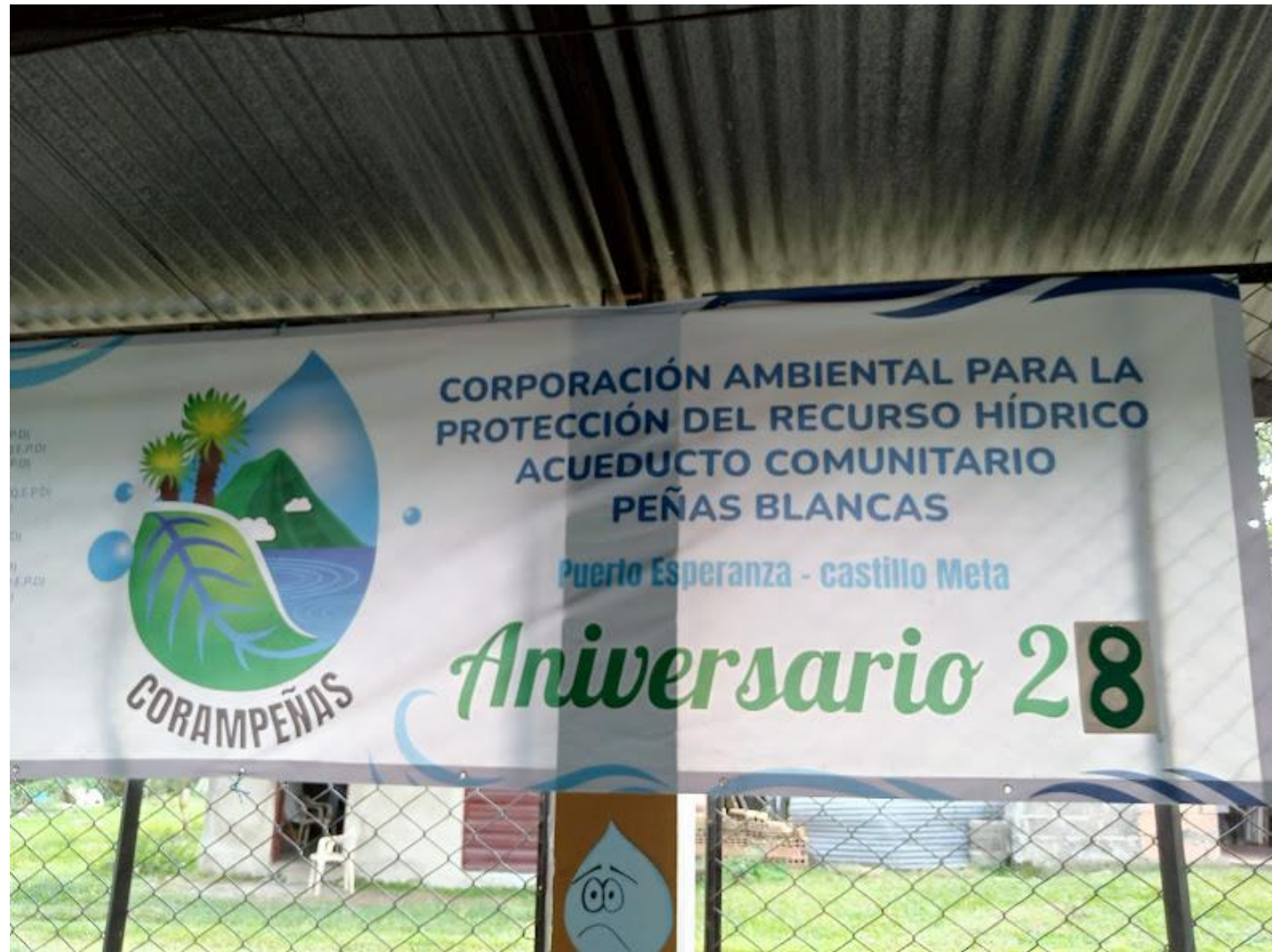
Celebración del aniversario 28 del acueducto comunitario para la protección del recurso hidrico acueducto comunitario