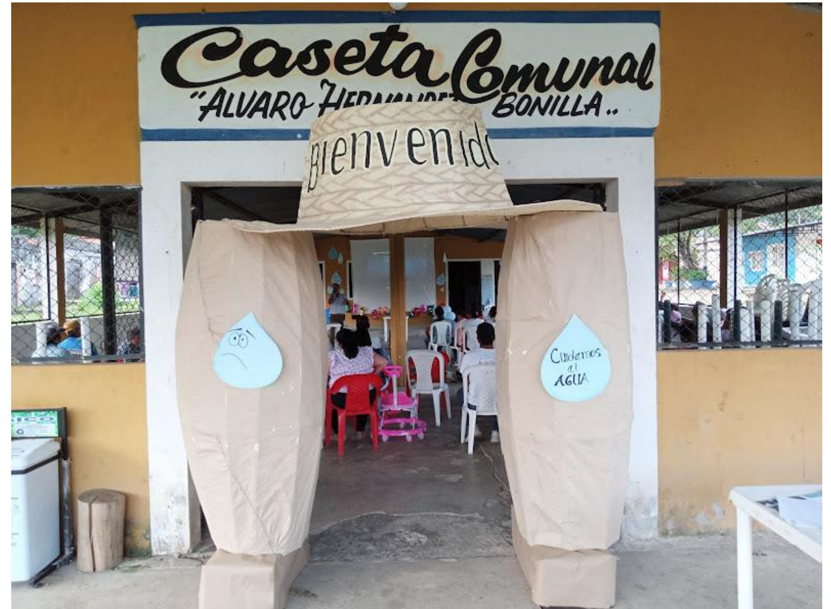
Formación para el proceso de formalización del acueducto y rechazo a la privatización.